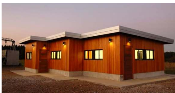
ExSitu Construcción Modular