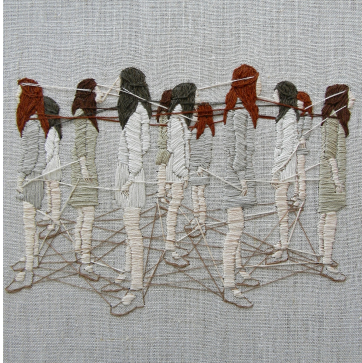
Bordado de la artista Michelle Kingdom